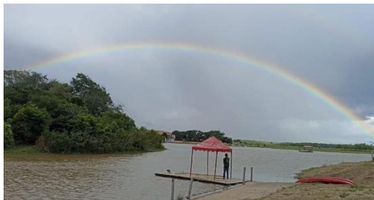
Fotografía 1. Bioreserva El Diamante.

Hacienda ubicada en el departamento del Meta, municipio de Puerto López, vereda la balsa, en el kilómetro 68.5 vía Villavicencio – Puerto López. Esta hacienda cuenta con un paisaje típico llanero y múltiples cuerpos de agua en sus inmediaciones (Fotografía 1).